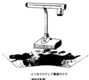
インタラクティブ書画カメラ (液晶表示機)