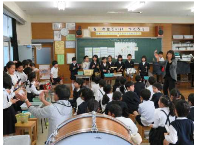
～2年生の音楽の交流学習から～

11月1日(木)3、4、5年生、15日(木)1、2年生が犀川小と交流学習を実施しました。犀川小の先生や子ども達は温かく迎え入れてくれて、子ども達は早くも友達が出来たようでした。