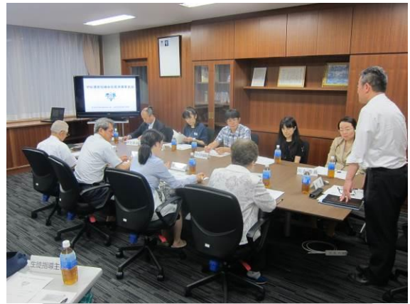
学校運営協議会設置準備委員会での話し合いの様子

また、「学校運営協議会」で話し合われたことを基に、実際に具体的な活動を行っていくのが、「地域学校協働本部」です。今年度は、現在も行っている登下校の見守りや図書館掲示、読み聞かせ等の活動を中心に行う予定です。「できる人が、できる時に、できる事を」をモットーにどのような活動ができるのか考えていきたいと思ひます。