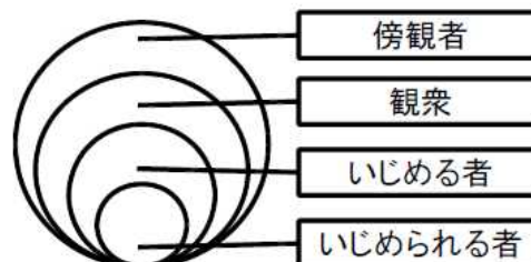
「いじめの四層構造」