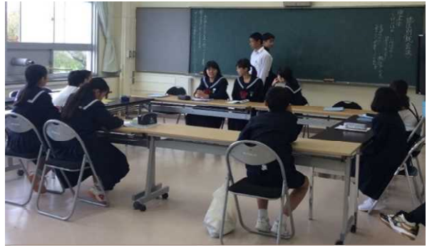
地区別「絆」会議の様子

中学校見学会と同じ日に、地区別「絆」会議を行いました。これは、兼六中校区4校の代表児童生徒が集まり、金沢「絆」会議で決定した来年度のテーマ「毎日元気にすごします」に基づき自分たちにできる取組を協議し決定するというものです。短い時間でしたが、積極的な意見交換ができ大変有意義な時間となりました。決定した取組は、下記の通りです。金沢「絆」プロジェクトとして、来年度の1学期から実践していきます。