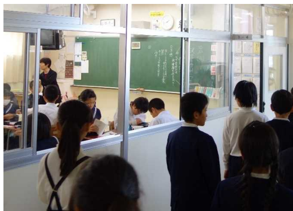
授業・校舎見学の様子

兼六中学校の生徒や先生方は、6年生の皆さんが来年4月に入学することを楽しみにしています。