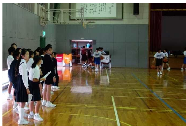
部活動見学の様子