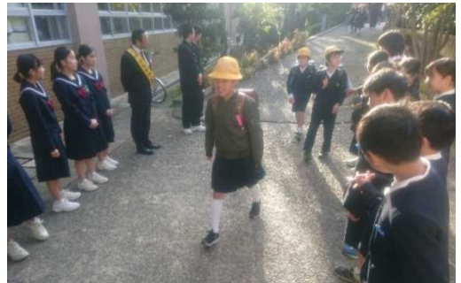
兼六小学校でのあいさつ運動

11月18日(月)に、兼六小と田上小で、小中連携あいさつ運動を行いました。兼六中から生徒会役員と2年リーダー会のメンバーが2小学校を訪問し、小学生とともに活動に取り組みました。兼六中校区の児童・生徒が一丸となって、元気にあいさつを交わす明るい地域を目指したいですね。