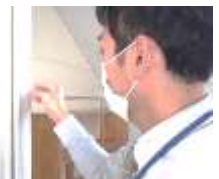
先生もがんばりました

3 年生は 3 年間過ごした学校に感謝の気持ちを込めて、丁寧にきれいに掃除してくれました。1, 2 年生はきれいにしてくれた先輩に感謝して校舎を大切に使うていきましょう。