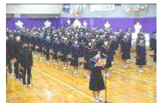
卒業記念品目録贈呈式