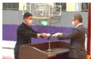
PTA 卒業記念品贈呈式