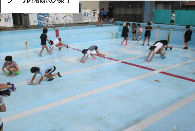
プール掃除の様子

7月上旬に、子どもたちがお家の人に向けてお手紙を書きますので、お返事を書いていただき、7月15日（金）までに担任まで提出していただけるよう、よろしくお願いします。