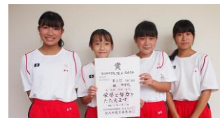
【4×100mリレー優勝メンバー】 【1年4×100mリレー優勝メンバー】