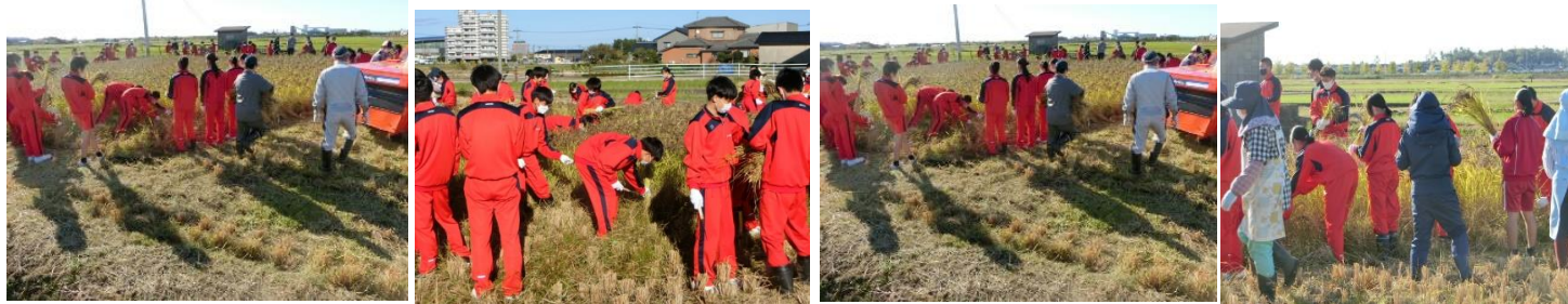
「実るほど、頭を垂れる稲穂かな」