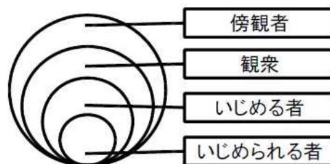
「いじめの四層構造」