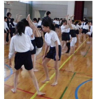
(高学年組体操練習)