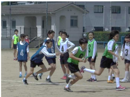
(高学年リレー練習)