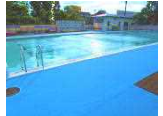
シートが貼られたプールサイド