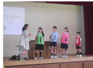
西山劇場で話し方紹介

6月4日（月）から一週間にわたり行われました学校公開週間には、授業だけでなく朝の会や休み時間の様子、給食の様子など日頃の子どもの生活全てを参観していただきました。アンケートにもご協力いただき、ありがとうございました。今後に役立てていきたいと思ひます。