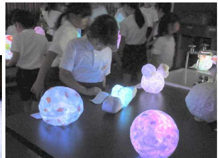
「光の形」にうっとり