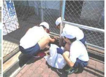
溝のそうじをする5年生