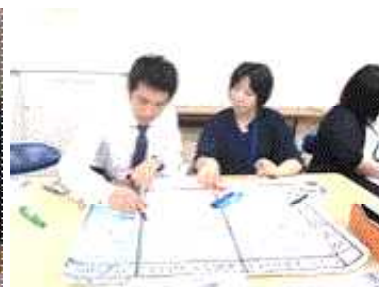
意見を交わす若手