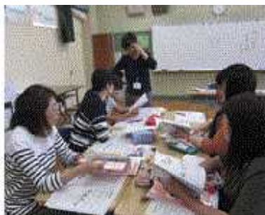
道徳の評価のあり方