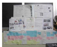
コピー機前の掲示版の利用