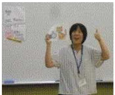
クラスルームイングリッシュの講習

①校内OJT（各教員の得意分野を生かした講習会等）を実施し、学校教育活動に必要な技術を伝授した。