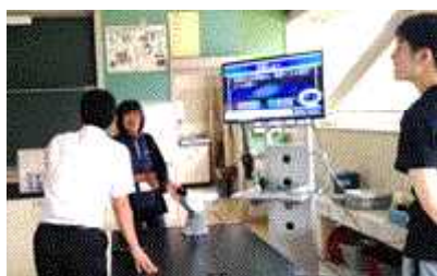
4年 デジタルスコープの使い方

①週1回の学年会を予定に明記して設定した。教材研究の充実を図ること、児童の情報交換、教室整備・掲示の方法など、あらゆるバリエーションでの学年会を学年単位のOJTととらえて行った。