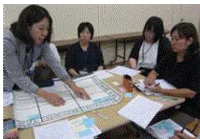
色分けした付箋を利用