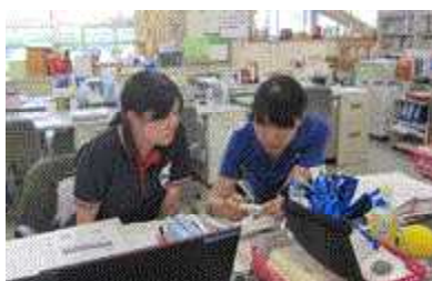
2年 写真による板書のふりかえり