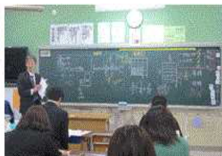
算数授業の構成、板書の三分割