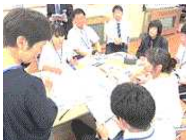
グループ協議の様子