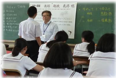
(登録者は、ボランティア保険に加入します)