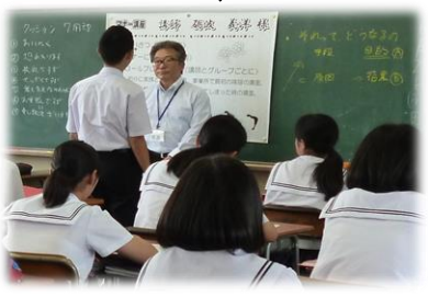
(登録者は、ボランティア保険に加入します)