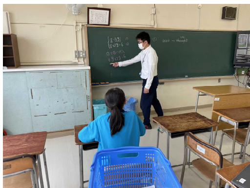
いつもの「質問教室」