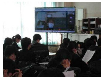
前日の最終打合せの様子

昨日の私立高校一般入試は、小さなトラブルはありましたが、大事にいたらず終了しました。3年生の受験した皆さん、お疲れ様でした。3年ぶりにインフルエンザの流行もあり健康管理には気を遣っていたのではないかと思います。インフルエンザによる影響のあった生徒はいましたが、まずは日程が無事に終わられたことがなによりです。ご家庭でも心配な日が続いていたことと思います。ご支援ありがとうございました。まずは一服…で良いかと思いますが、自分の目標を再確認し、次の準備へと再始動しましょう。公立高校(全日制)の入試まで「あと1ヶ月」です。さらに定時制、通信制へと続きます。努力を惜しまずに、諦めずに、有意義な1ヶ月を過ごしてください。