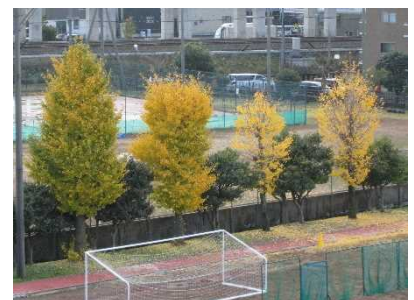
運動場のイチョウも紅葉しています

本日、12月14日(水)から実施予定の保護者懇談会(1、2年生は通知表渡し・3年生は三者懇談会)の実施予定(懇談時間)の表が配付されています。必ずご確認くださいませようお願ひいたします。2学期を終えるに当たっての保護者の方との懇談は貴重な機会となります。年末という慌ただしい時期ではありますが、どうぞよろしくお願ひいたします。3年生にとっては、受験校決定という三者懇談会となります。事前のご家庭での話し合いも含め、有意義な機会となりますようお願い申し上げます。