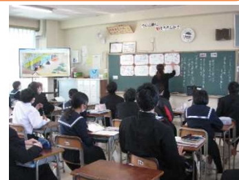
高岡中での授業の様子

高岡中学校区の小中学校(高岡中、新神田小、米丸小、中央小)は小中一貫教育に取り組んでいます。1学期には小学校の先生が中学校の授業を参観し協議を行いました。今回は、中学校の先生が分担して小学校を訪問し授業参観を行います。先週金曜日は、米丸小と中央小を訪問し、明日は新神田小を訪問し授業参観を予定しています。小学校と中学校が連携し、9年間の義務教育が有意義な期間となるよう努めています。小学校の授業で得られたことは、ぜひ中学校でも効果的に活用していきたいことです。また「中1ギャップ」と言われるような問題に対し小学校から中学校へのスムーズな進学が行われるようにも努めています。中央小学校を訪問するのは今年が最後となります。これまでのご協力に心より感謝申し上げます。